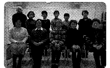
点字サークル楽点会の皆さん

広島市や西区社協、特別支援学校等の依頼を受けて、広報紙や教材など幅広く点訳を行っています。個人からの依頼で小説や資格関連書籍等の点訳を行うことも増えており、常に相手への「伝わりやすさ」を意識して取り組んでいます。福祉まつり・ボランティアまつりでの点字体験コーナーや学校での福祉体験学習への協力等、西区社協と関わりの深い活動も行っています。